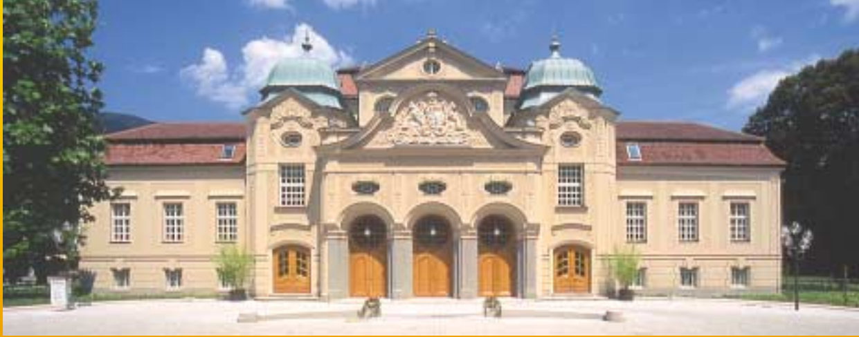
Das alte Königliche Kurhaus des Architekten Max Littmann mit drei historischen Konzertsälen.

Tourist-Info Bad Reichenhall Kartenvorverkauf Wittelsbacherstr. 15 83435 Bad Reichenhall